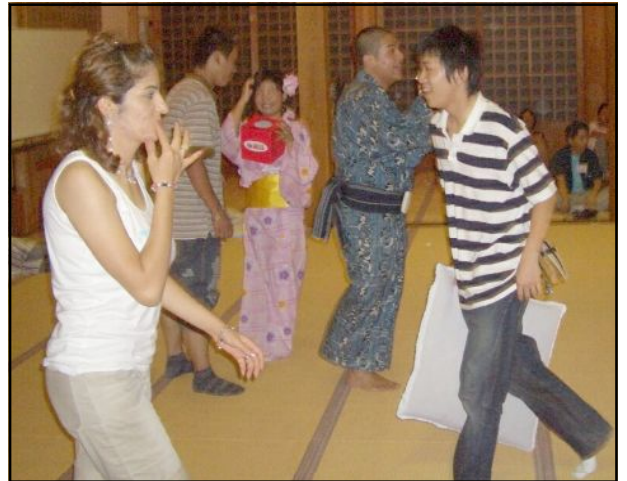
ゲームで気持ちをほくそう

今回で交流会に行くと2回目になります。やっ ぱり初めは友達ができるか心配だったけど、いっ ぱいの子としゃべれて、前より楽しく過ごせた ような気がします。色々な友達から自分の祖国の 話や自分のあったつらいことなど聞いて勉強に もなったし、そうやって話してくれるのがとても うれしかった。 (兵庫・コリアン・高校)