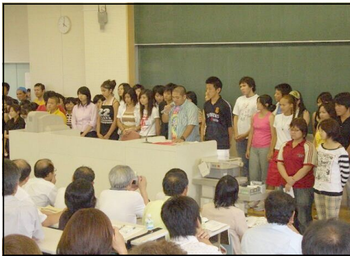
二日間の成果を発表